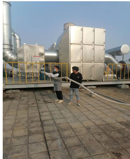
对着火的喷淋塔进行灭火