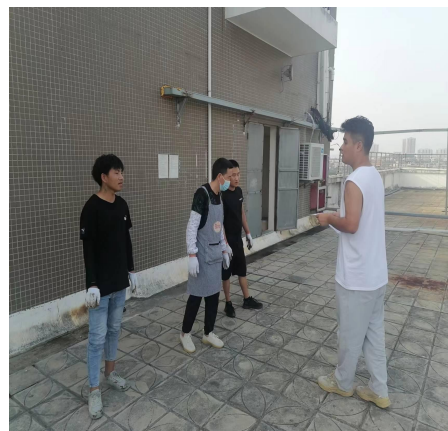
对此次演练进行总结