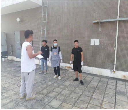
演练前针对此次演练过程进行讲解及 人员任务分配