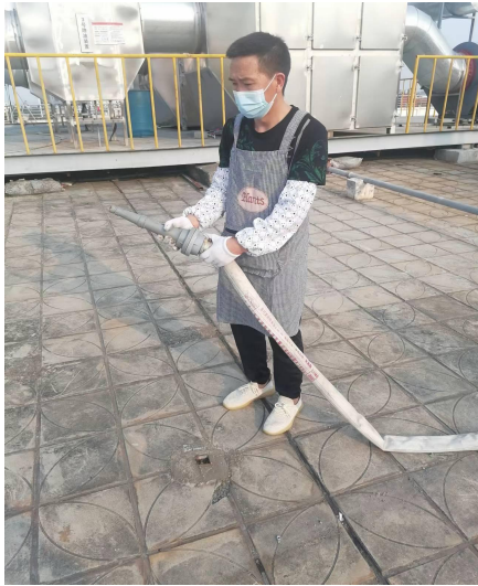
连接水带水枪准备灭火